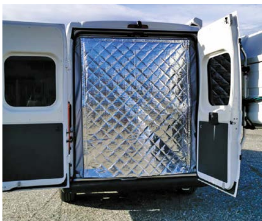
Isolation avec multicouche

* Sous réserve de possibilité technique.