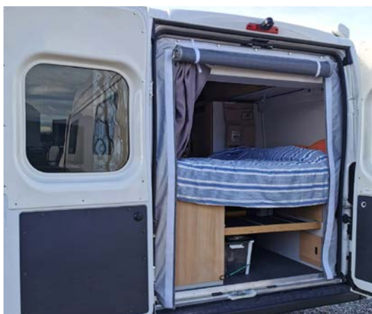
Ouverture intégrale zippée