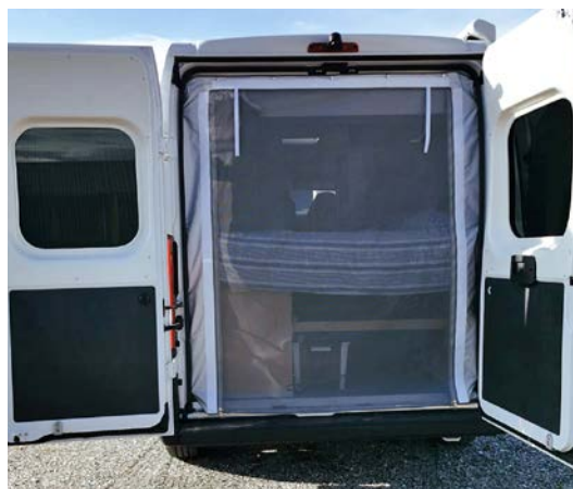
Isolation avec moustiquaire