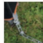
Tensores elásticos: fijaciones al suelo resistentes