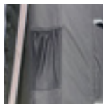
Bolsillo de almacenaje de correas