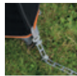
Tensores elásticos: fijaciones al suelo resistentes