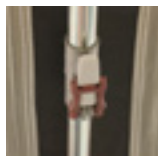
Estructura de acero con cierre rápido